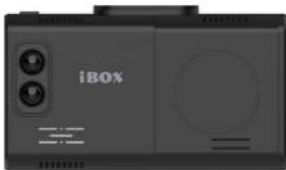
Радар-детектор iBOX Alert LaserScan Signature Cloud