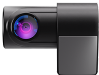
Установка на заднее стекло