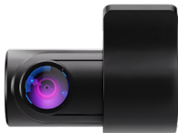
Установка на лобовое стекло

Для правильного выведения информации на экран устройства камеру необходимо установить так, как показано на рисунке ниже. Иначе изображение будет перевернутым.